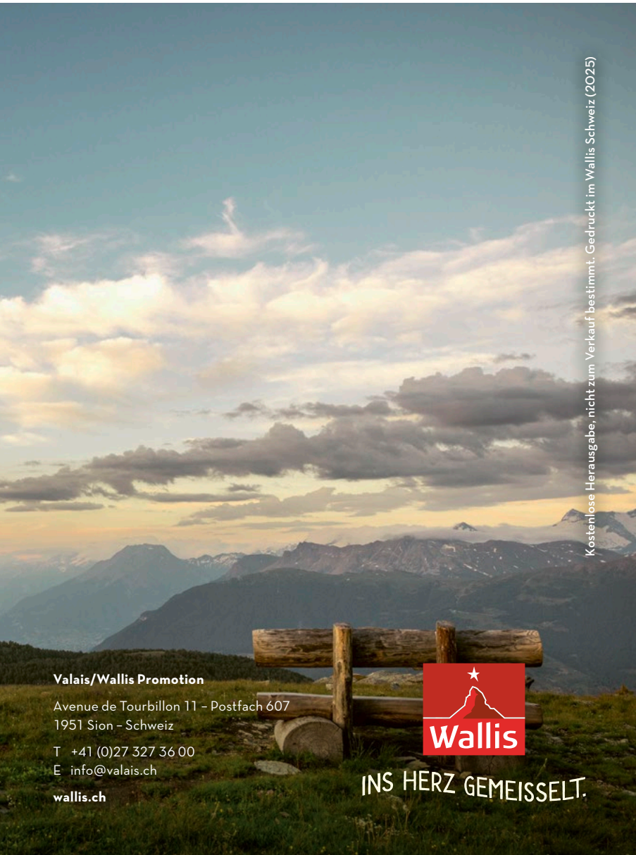
Kostenlos Herausgabe, nicht zum Verkauf bestimmt. Gedruckt im Wallis Schweiz (2025)

Wintervergnügen gibt es im Wallis auch gemächlich und entspannt. Eine Wanderung durch verschneite Wälder oder ein Schneeschuttrekking durch die hochalpine Landschaft lassen Seele und Geist zur Ruhe kommen. Sanft schreiten Schneeschuhlaufende über die dicke Schneedecke. Auf wunderschönen Trails geht es durch Wälder und über weite Schneefelder, vorbei an eindrucklichen Viertausendern. wallis.ch/winterwandern